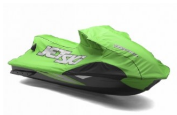
COVER € 334,10