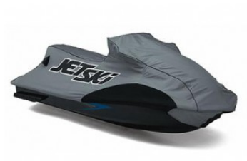
COVER € 317,15