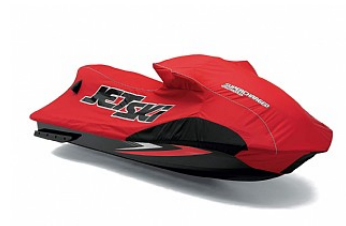
COVER ULTRA250X € 277,75