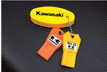
Smart Learner Operation (SLO) mode