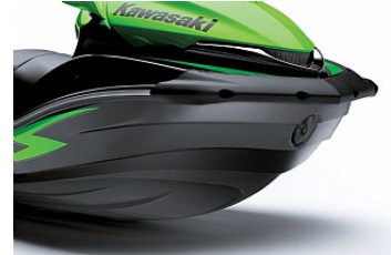
Quatro KSD (Kawasaki Splash Deflectors)