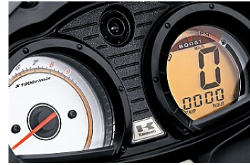
Kawasaki Smart Steering (KSS)